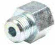
Dişi Nipel ЖЕНСКАЯ НИПЕЛЬ FEMALE NIPPLE