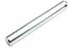
Ei Arabası Teker Pimi ШТИФТ ОСИ ТАЧКИ WHEELBARROW AXLE PIN