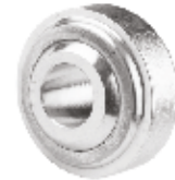
Frezeli Yan Kol Başı ФРЕЗЕРОВАННАЯ ГОЛОВА БОКОВОЙ РУЧКИ MILLED SIDE ARM HEAD