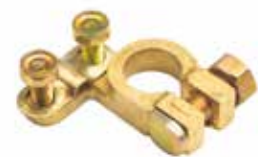
Kutupbaşı КЛЕММА АККУМУЛЯТОРА BATTERY TERMINAL