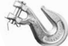
Zincir Kançası ЦЕПНОЙ КРЮК CHAIN HOOK

16078 1/4 (6mm) 16080 5/16 (8mm) 16079 3/8 (10mm) 16087 1/2 (12mm)