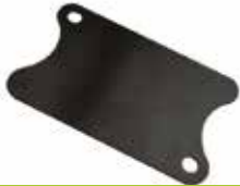
Şanzuman Alt Sacı НИЖНЯЯ КРЫШКА ТРАНСМИССИИ TRANSMISSION BOTTOM COVER PLATE