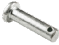
İç Gergi Zinciri Pimi ВНУТРЕННИЙ ШПЛИНТ НАТЯЖНОЙ ЦЕПИ INNER TENSION CHAIN PIN