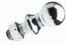
Намаş Topuzu Somunlu РУКОЯТКА/КНОПКА С ГАЙКОЙ NUTTED HAMMER/TAXI KNOB

16071 28mm 16205 25mm 16126 22mm 16206 30mm