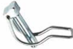
Yan Gergi Pimi ШТИФТ БОКОВОГО НАТЯЖЕНИЯ SIDE TENSION PIN