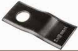
Çayır Biçme Viçağı БАРАБАН/ЛЕЗВИЕ ДЛЯ СЕНА - SAĞLAMEL DRUM / GRASS CUTTING BLADE - SAĞLAMEL