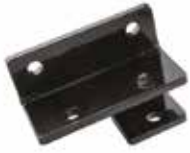
Teleskopik Yan Gergi Papucu ПОДУШКА БОКОВОГО НАТЯЖЕНИЯ ТЕЛЕСКОПИЧЕСКАЯ TELESCOPIC SIDE TENSION PAD