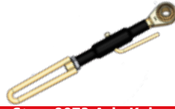
Steyr 8073 Askı Kolu ПОДПОРНАЯ РУЧКА ЗОЛОТОЙ STEYR 8073 STEYR 8073 GOLD SUPPORT ARM