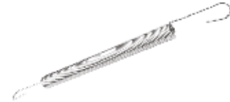
Yan Kol Ara Yayı ПРУЖИНА РЕГУЛИРОВКИ БОКОВОЙ РУЧКИ SIDE ARM ADJUSTING SPRING