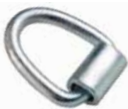
Zincir Halkası Borulu ЦЕПНОЕ ЗВЕНО TUBULAR CHAIN LINK