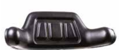
Kolçaklı Sırtlık - 32012 СПИНКА ПОДЛОКОТНИКА ARMREST BACKREST