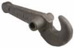
Römork Çeki Kancası БУКСИРОВОЧНЫЙ КРЮК ПРИЦЕПА TRAILER TOW HOOK