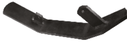
Rotavatör Kızağı Takımı НАБОР СКИДОВ РОТОВАТОРА ROTAVATOR SKID SET