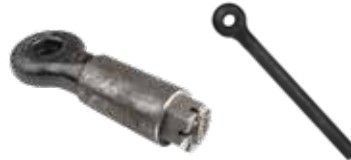
İslenmiş Okması ФРЕЗЕРОВАННЫЙ ШТЫРЬ MACHINED SHANK