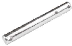
Gövde Pernosu Yeni Model ШПЛИНТ КОРПУСА Y.M. BODY PIN Y.M.