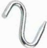
S Kanca КРЮК S S HOOK

16073 12mm 16075 16mm 16074 14mm 16086 10mm