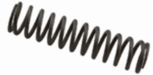
Gübre Keççesi Yayı ПРУЖИНА ЛОПАТЫ УДОБРЕНИЯ FERTILIZER SCOOP SPRING