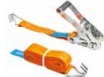
Spanzet РЕМЕНЬ С ТРЕЩОТКОЙ RATCHET STRAP - LOCAL

16214 2" Circirli 16212 4000-8000 kg 16203 2500-3000 kg 16213 5000-10000 kg 16202 3000-6000 kg