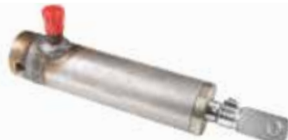
Çatallı Fren Pistonu ВИЛОЧНЫЙ ТОРМОЗНОЙ ПОРШЕНЬ FORKED BRAKE PISTON