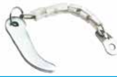
Kasa Kaması ОДИНАРНЫЙ КЛИНОВОЙ БЛОК WEDGE BLOCK

16046 Tekli 16047 Çiftli 16050 Zincirsiz