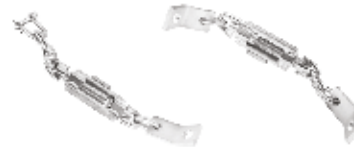
Yan Gergi Mekanizması МЕХАНИЗМ БОКОВОГО ТЯГАЧА SIDE TENSIONER MECHANISM