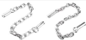
Yan Kol Ara Zinciri ЦЕПЬ БОКОВОЙ РУЧКИ SIDE ARM CHAIN