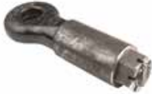
Borulu Ok Başı ТРУБЧАТЫЙ СТЕРЖЕНЬ TUBE SHANK