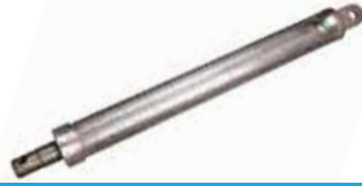
Kerçe Lifti ПОДЪЕМНИК ЗАГРУЗЧИКА LOADER LIFT