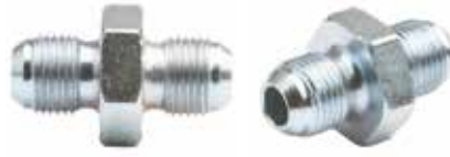
Ara Nipel ПРОМЕЖУТОЧНАЯ НИПЕЛЬ INTERMEDIATE NIPPLE