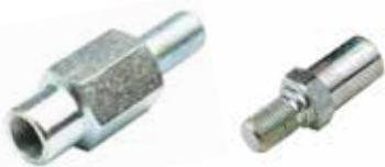
Arka Ağırlık Civatası БОЛТ ЗАДНЕГО ГРУЗА БОЛЬШОЙ REAR WEIGHT BOLT LARGE