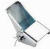
Damper Menteşesi МАЛАЯ ПЕТЛЯ SMALL DUMPER HINGE