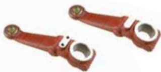
Frezeli Yan Kol ЛАМИНИРОВАННАЯ БОКОВАЯ РУЧКА 480 FLAILED SIDE ARM 480