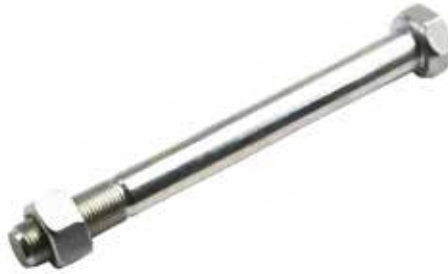
Çamurluk Civatası БОЛТ КРЫЛА MUDGUARD BOLT

20022 16cm 20023 19cm 20024 22cm 20025 26cm 20026 24cm