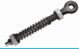
Yaylı Ok Başı ПРУЖИНЫЙ СТЕРЖЕНЬ SPRING SHANK