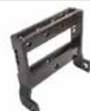
Çeki Sehпасı ПОДСТАВКА ДЛЯ ВЫТЯЖНОГО ШТИФТА DRAW STAND