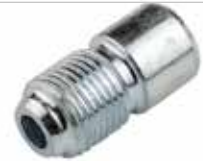
Kaynaklık Nipel СВАРОЧНАЯ НИПЕЛЬ WELDING NIPPLE