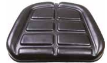
Koltuk Minderi - 32007 ПОДУШКА СИДЕНЬЯ ЧЕРНОГО ЦВЕТА SEAT CUSHION BLACK