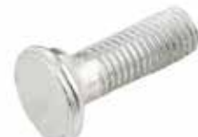
Alpler Pulluk Civatası БОЛТ ПЛУГА ALPLER - DEMİR ALPLER PLOW BOLT - DEMİR