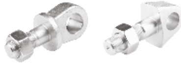
Same Gergi Civatası БОЛТ ТЯГАЧА SAME SAME TENSIONER BOLT