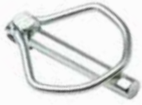
Yaylı Pim ПРУЖИННЫЙ ШТИФТ SPRING PIN