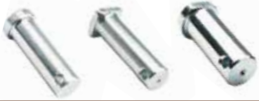
Askı Kol Pimi КОРОТКИЙ ШТИФТ ПОДВЕСКИ SUSPENSION ARM PIN SHORT