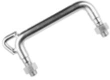
Steyr Yan Kol БОКОВАЯ РУЧКА STEYR U-ОБРАЗНАЯ TEYR SIDE ARM U-SHAPED