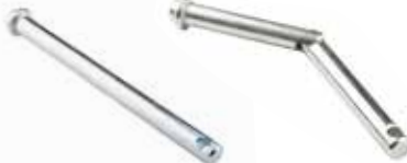
Semer Pimi ШПЛИНТ БЕЗОТКАЗНЫЙ BREAKLESS PIN