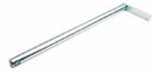
Alt Tabla Pimi КОРОТКИЙ ШТИФТ НИЖНЕЙ ПЛАСТИНЫ LOWER PLATE RIVET

10015 220mm 10017 263mm 10016 360mm 10018 316mm