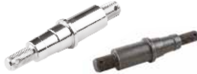
Yan Gövde Pernosu ШПЛИНТ БОКОВОГО КОРПУСА SIDE BODY PIN