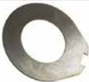
Fren Disk Sacı ПЛАСТИНА ТОРМОЗНОГО ДИСКА BRAKE DISC PLATE