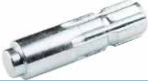
Kuyruk Mil Freze Ucu ВАЛ ВОМ (ОДИНОЧНЫЙ) PTO SHAFT MILL TIP (SINGLE MILL)

20003 Çift Freze 20044 Isıl İşlemli 20002 Isıl İşlemli