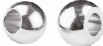
Dana Gözü ГЛАЗ БУКВАЛЬНО С ШИРОКИМ ОТВЕРСТИЕМ BULL'S EYE WIDE HOLE