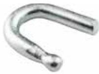
Tek Kanca (İp Kancası) ОДИНОЧНЫЙ КРЮК SINGLE HOOK