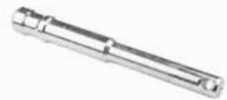
Parlayan Tiller Pimi ШПЛИНТ МАШИНЫ РАСПЫЛИТЕЛЯ PARLAYANLAR PARLAYANLAR SPRAYER MACHINE PIN