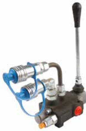
Kumanda Kolu РЫЧАГ УПРАВЛЕНИЯ МОНОБЛОЧНЫЙ MONOBLOCK CONTROL LEVER