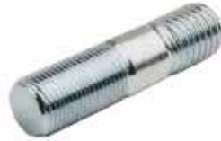
Alt Tabla Saplaması ЗАКЛЕПКА НИЖНЕЙ ПЛАСТИНЫ LOWER PLATE RIVET

10011 480 10033 640 19023 MF 135/240/255/240T