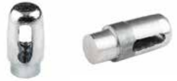
Baba Erkeği ОГОЛОВОК БОЛЛАРДА BOLLARD HEAD

16053 Kısa 16054 Uzun 16094 İlave Baba Erkeği 160123 Dipsiz