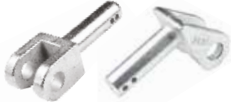
Gergi Bağlantı Çatalı СВЯЗУЮЩИЙ ВИЛКИ ТЯГАЧА TUMOSAN TENSIONER CONNECTING FORK TUMOSAN