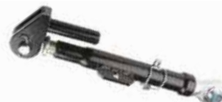
Teleskopik Yan Gergi ТЕЛЕСКОПИЧЕСКАЯ БОКОВАЯ РУЧКА НОВОЙ СЕРИИ TELESCOPIC SIDE TENSION - ESAEREN