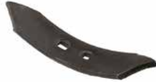
Yılan Dili ЗМЕИНЫЙ ЯЗЫК - DEMİRAY SNAKE TONGUE - DEMİRAY

28003 65x12mm 28210 60x12mm 28003 60x12mm - eco