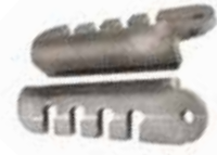
Rotavatör Gergisi ТЯГАЧ РОТОВАТОРА ROTAVATOR TENSIONER