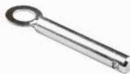
Merdane Pimi ШПЛИНТ РОЛИКА АЙСАН AYSAN ROLLER PIN

28093 Italyap Tip 28020-1 Kırmızı 28020 Siyah 28094 Yurdusar 28217 ithal tip-9mm Ön Patik