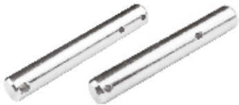
Gövde Pernosu ШПЛИНТ КОРПУСА BODY PIN