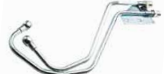
Hidrolik Damper Boru Seti КОРОТКИЙ КОМПЛЕКТ ТРУБ ГИДРАВЛИЧЕСКОГО АМОРТИЗАТОРА HYDRAULIC DAMPER PIPE SET

25055 MF iki çıkış 3x8 26012 FIAT İKİ ÇIKIŞ 3x8 25058 MF dört çıkış 3x8 26014 FIAT dört çıkış 3x8 26011 MF altı çıkış 3x8 26016 FIAT altı çıkış 3x8