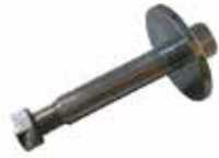
Alpler Izgara Pimi ШПЛИНТ СЕТКИ ALPLER ALPLER GRILL PIN