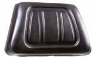
Koltuk Sırtlığı - 32006 СПИНКА СИДЕНЬЯ ЧЕРНОГО ЦВЕТА SEAT BACKREST BLACK