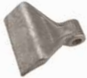
Dal Kırma Baltası ОРУДИЕ ДЛЯ ПЛУГОВ PLOWING AXE