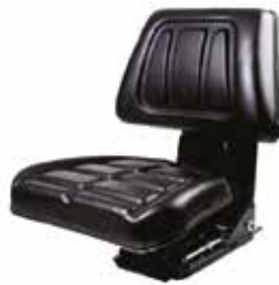
Traktör Dereceli Koltuk - 32005 СИДЕНЬЕ ТРАКТОРА С ГРАДУИРОВАНИЕМ ЧЕРНОГО ЦВЕТА - С ДВИЖЕНИЕМ GRADUATED TRACTOR SEAT BLACK - SLIDING