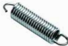
Fren Pedal Yayı ПРУЖИНА ПЕДАЛИ ТОРМОЗА BRAKE PEDAL SPRING