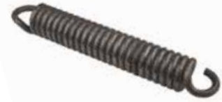
Çara Yayı ПРУЖИНА ЛОПАТЫ HOE SPRING

28005 12x23 28007 10x28 28006 12x22 28008 10x26