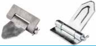
Üçgen Menteşe ТРЕУГОЛЬНАЯ ПЕТЛЯ TRIANGLE HINGE