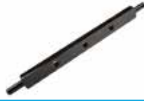
Delikli Demir Düz ПРОФИЛЬНАЯ ПЕРФОРИРОВАННАЯ ПЛАСТИНА PERFORATED FLAT IRON