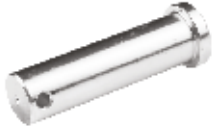
Çeki Oku Pimi ПРЯМОЙ ВЫТЯЖНОЙ ШТИФТ STRAIGHT DRAW PIN