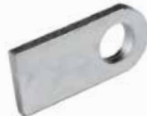
Delikli Lama РАЗРЕЗНАЯ ШИНА SLITTED BAR