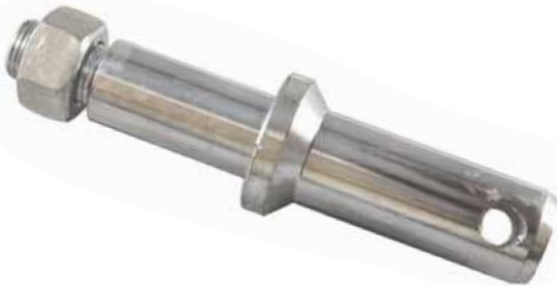
Tiller Pimi ШПЛИНТ ПЛУГА - TILLER PIN