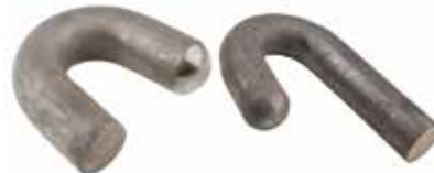
Silaj Çeki Kancası СИЛОСНЫЙ БУКСИРОВОЧНЫЙ КРЮК SILAGE TOW HOOK