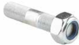
Gergi Zincir Saplaması ЗАКЛЕПКА НИЖНЕЙ ПЛАСТИНЫ MASSEY FERGUSON 135 (3/4) MASSEY FERGUSON 135 LOWER PLATE RIVET (3/4)