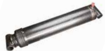
Römork Pistonu ПОРШЕНЬ ПРИЦЕПА TRAILER PISTON

25001 3 Ton 5/8 25002 5 Ton 3/4 25003 5 Ton 3/4 Uzun