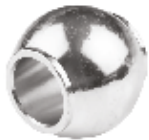
Dana Gözü ГЛАЗ БУКВАЛЬНО С ШИРОКИМ ОТВЕРСТИЕМ BULL'S EYE WIDE HOLE