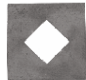
Tırmık Pimi Sacı ПЛИТА ШПЛИНТА БОЧКИ HARROW PIN PLATE

28091 22x275mm 28104 22x240mm 28092 20x210mm 28114 26x250mm 28102 20x180mm 28110 24x250mm