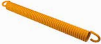
Tambur Yayı ПРУЖИНА БАРАБАНА DRUM SPRING