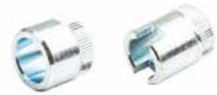
Hidrolik Semer Burcu ПРЯМАЯ ВТУЛКА ГИДРАВЛИЧЕСКОГО СИДЕНЬЯ HYDRAULIC SEAT BUSH STRAIGHT