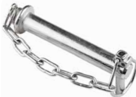
Orta Kol Pimi Zincirli ШПЛИНТ СРЕДНЕГО РЫЧАГА MIDDLE ARM PIN

23004 19mm 12cm 23008 22mm 12cm 23011 25mm 12cm 23019 28mm 12cm