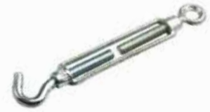
Gerdirme ТАЛРЕП TURNBUCKLE