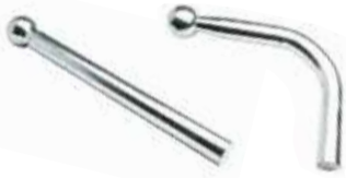
Намаş Topuzu ДЛИННАЯ РУКОЯТКА/КНОПКА LONG HAMMER/TAXI KNOB