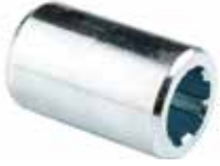
Kuyruk Mil Freze Ucu ВАЛ ВОМ ЖЕНСКИЙ КОРОТКИЙ PTO SHAFT MILL FEMALE TIP SHORT