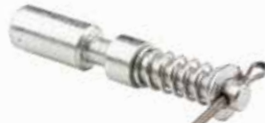
Şaft Pimi Uzun ДЛИННЫЙ ШПЛИНТ ПРОМЕЖУТОЧНОГО ВАЛА LONG INTERMEDIATE SHAFT PIN