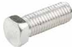
Ünlü Pulluk Civatası БОЛТ ПЛУГА ÜNLÜ - DEMİR ÜNLÜ PLOW BOLT - DEMİR