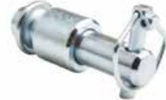
Çeki Oku Pimi Burçlu Takım КОМПЛЕКТ ВЫТЯЖНОГО ШТИФТА С ВТУЛКОЙ DRAW PIN WITH BUSHING SET