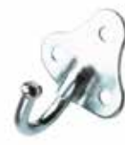
Saclı Kanca КРЮЧОК С ПЛАСТИНОЙ HOOK WITH PLATE