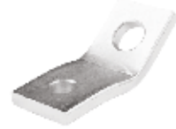
Yan Gergi Laması ПЛИТА БОКОВОГО НАПРЯЖЕНИЯ SIDE TENSION PLATE