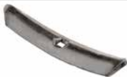
Aysan Patik (Yılan Dili) БОТИНК АЙСАН ИТАЛЬЯНСКОГО ТИПА AYSAN BOOT ITALIAN TYPE

28093 Italyap Tip 28020-1 Kırmızı 28020 Siyah 28094 Yurdusar 28217 ithal tip-9mm Ön Patik