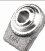
Yan Kol Başı ГОЛОВА БОКОВОЙ РУЧКИ 55/46-70/56 ШИРОКИЙ ТИП 28 мм (НАКЛОНЕННАЯ) 55/46-70/56 SIDE ARM HEAD WIDE TYPE 28 MM (SLOPED)