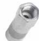
Gres Pompa Hortum Ucu B Serisi НАСАДКА ШЛАНГА НАСОСА ДЛЯ СМАЗКИ СЕРИИ В GREASE PUMP HOSE TIP B SERIES