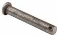
Q12mm Pim ШПЛИНТ (U-ОБРАЗНЫЙ ЗАМОК) PIN (U LOCK PIN)

16214 2" Circirli 16212 4000-8000 kg 16203 2500-3000 kg 16213 5000-10000 kg 16202 3000-6000 kg