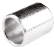
Dana Gözü Daraltma Burcu УЗКИЙ ЧЕХОЛ DANAGÖZÜ 22-28 мм DANAGÖZÜ NARROWING SLEEVE 22-28 mm