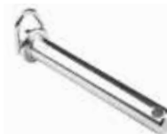
Römork Çeki Pimi ТЯГОВОЙ ШПЛИНТ ПРИЦЕПА TRAILER TOW PIN