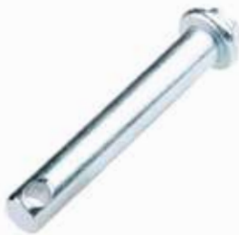
Orta Kol Pimi ШПЛИНТ СРЕДНЕГО РЫЧАГА MIDDLE ARM PIN

23002 19mm 12cm 23003 19mm 15cm 23005 19mm 17cm 23006 22mm 12cm 23007 22mm 15cm 23009 25mm 12cm 23010 25mm 15cm 23013 28mm 12cm 23014 28mm 15cm 10029 19mm 9cm 10030 25mm 9cm