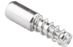
Şaft Pimi Kısa КОРОТКИЙ ШПЛИНТ ПРОМЕЖУТОЧНОГО ВАЛА SHORT INTERMEDIATE SHAFT PIN