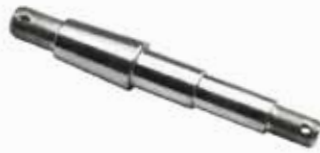
Ford Gövde Pernosu КОРОТКИЙ ШПЛИНТ КОРПУСА FORD 3000 FORD 3000 BODY PIN SHORT