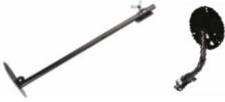
Tepe Lambası Braketi КРОНШТЕЙН ДЛЯ ВЕРХНЕЙ ЛАМПЫ TOP LAMP BRACKET ELEVATING