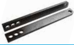
Alt Çeki Laması НИЖНЯЯ ПЛАСТИНА СОЕДИНЕНИЯ LOWER LINK CONNECTION PLATE