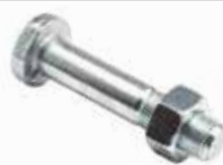
Jant Civatası Болт обода RIM BOLT