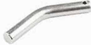
Saban Teker Pimi ШПЛИНТ КОЛЕСА ПЛУГА ALPLER PLOW WHEEL PIN ALPLER