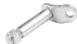
Kulaklıklı Civata БОЛТ ЗУБЧАТОГО КОЛЕСА LUG BOLT