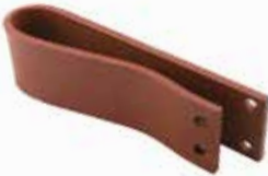
Hidrolik Yay ГИДРАВЛИЧЕСКАЯ ПРУЖИНА HYDRAULIC SPRING