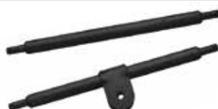
Yan Kol Ara Demir БАР БОКОВОЙ РУЧКИ SIDE ARM BAR