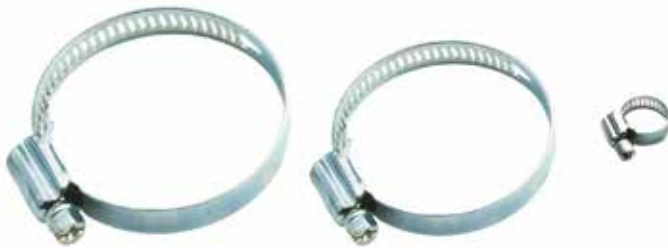
Ayarlı Sac Kelepçe ЗАЖИМ ДЛЯ ЛИСТОВ SHEET CLAMP