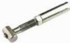
Fren Ayar Çubuğu ШТОК РЕГУЛИРОВКИ ТОРМОЗА BRAKE ADJUSTMENT ROD