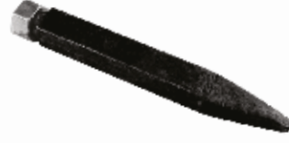
Tırmık Pimi ШПЛИНТ БОЧКИ HARROW PIN

28091 22x275mm 28104 22x240mm 28092 20x210mm 28114 26x250mm 28102 20x180mm 28110 24x250mm