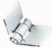
Yaprak Menteşe ПЕТЛЯ НА ЛИСТЕ LEAF HINGE

16055 Takim 16056 Tek Sac 16065 Tırtıklı Pim