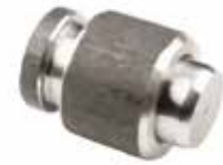
Devirme Menteşesi ПЕТЛЯ ДЛЯ НАГРУЗКИ TIPPING HINGE