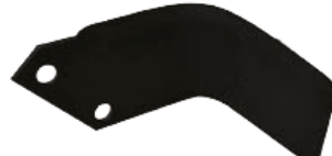
Rotavatör Bıçağı ЛЕЗВИЕ РОТОВАТОРА 7-8 ММ С ТИПОМ С - DEMİRAY ROTAVATOR BLADE 7-8 MM C TYPE - DEMIRAY

28062 8mm C Tip 28064 7mm L Tip 28063 8mm L Tip 28049 7mm C Tip