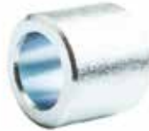
Çeki Oku Sabitleme Burcu ВТУЛКА КРЕПЛЕНИЯ ВЫТЯЖНОГО ШТИФТА DRAW PIN FIXING BUSH