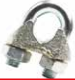
Halat Klemensi ХОМУТ CLAMP