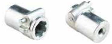
Kompresör Frezesi ФРЕЗА КОМПРЕССОРА COMPRESSOR MILLING CUTTER

20033 17mm 20035 30mm 20034 25mm 20036 35mm