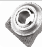
Yan Kol Başı ФИКСИРОВАННЫЙ ЗАХВАТ FIAT 480 - ESAEREN FIAT 480 FIXED FORK - ESAEREN