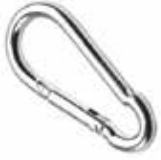
Karabina КАРАБИН CARABINER