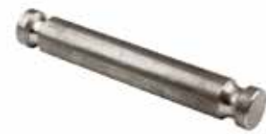
Kanallı Pim ПИН С ПРУЖИНОЙ С СТРУЖКОЙ SPRING HOE GROOVED PIN