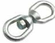
Fırdöndü ВЕРТЛЮГ SWIVEL