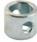
Boşluk Burcu ВТУЛКА-ПРОКЛАДКА SPACER BUSHING