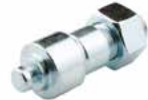
Fren Tablası Eksantriği ЭКСЦЕНТРИЧЕСКАЯ ПЛАСТИНА ТОРМОЗА BRAKE PLATE EXCENTRIC