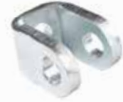
Yan Gergi Çatalı ЗАХВАТ НАПРЯЖЕНИЯ 240 С БОЛТОМ 240 SIDE TENSION FORK BOLTED