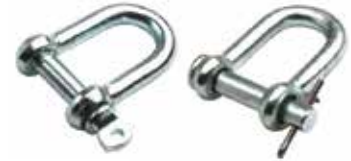
U (Zincir) Kilidi СКРЕПКА U-ОБРАЗНАЯ U-SHACKLE