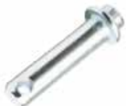
Çeki Oku Pimi ШТИФТ PIN

10015 220mm 10017 263mm 10016 360mm 10018 316mm