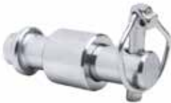
ÇEKİ OKU SABİTLEME PİM TAKIMI КОМПЛЕКТ КРЕПЛЕНИЯ ВЫТЯЖНОГО ШТИФТА DRAW PIN FIXING PIN SET

20033 17mm 20035 30mm 20034 25mm 20036 35mm