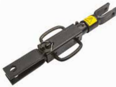
Sabit Ayarlı Kol Takımı РЕГУЛИРУЕМАЯ ТЯГА ADJUSTABLE ARM