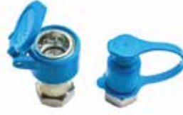
Ferro Adaptör НАБОР АДАПТЕРОВ FERRO FERRO ADAPTER SET