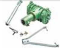
Hava Kompresörü ШПЛИНТ БЕЗОТКАЗНЫЙ BREAKLESS PIN