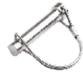
Çapa Pimi КОРОТКИЙ ШТИФТ ГРЕБЕНКИ TINE PIN