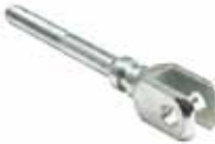
Fren Çatalı ТОРМОЗНАЯ ВІЛКА BRAKE FORK