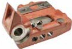
Hidrolik Yay Sehпасı СТОЙКА ГИДРАВЛИЧЕСКОЙ ПРУЖИНЫ (ТРИ ОТВЕРСТИЯ) HYDRAULIC SPRING STAND (THREE HOLES)