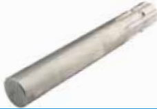
Kuyruk Mil Freze Ucu (Tek Freze) ВАЛ ВОМ ДЛИННЫЙ (ОДИНОЧНЫЙ) PTO SHAFT MILL TIP LONG (SINGLE MILL)