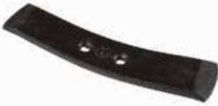
Patlatma Ucu ЛЕЗВИЕ RIPPER - DEMİRAY RIPPER BLADE - DEMİRAY

28001 6mm Isıl İşlemlili 28018 8mm Isıl İşlemlili 28098 8mm 28209 7mm