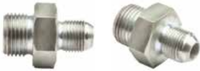
Ara Nipel ПРОМЕЖУТОЧНАЯ НИПЕЛЬ INTERMEDIATE NIPPLE