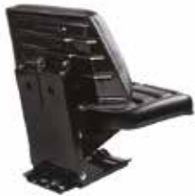
Traktör Lüks Koltuk - 32001 ПЛОСКОЕ СИДЕНЬЕ ТРАКТОРА - С ДВИЖЕНИЕМ FLAT TRACTOR SEAT - SLIDING