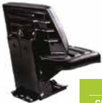
Traktör Sabit Kolçaklı Koltuk - 32002 СИДЕНЬЕ С ФИКСИРОВАННЫМ ПОДЛОКОТНИКОМ ЧЕРНОГО ЦВЕТА - С ДВИЖЕНИЕМ FIXED ARMREST SEAT BLACK - SLIDING