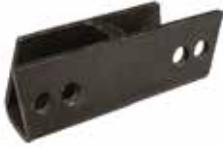
Çamurluk Yükseltme Demiri ПОДЪЕМНАЯ СКОБА КРЫЛА FENDER LIFT IRON

20029 Siyah 20042 Kırmızı 20031 Mavi 20041 Turuncu 20043 Küçük