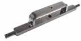
Delikli Demir Köprü ПРОФИЛЬНАЯ ПЕРФОРИРОВАННАЯ ПЛАСТИНА С МОСТОМ PERFORATED IRON WITH BRIDGE