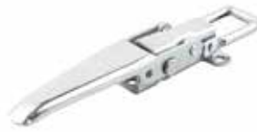
Transit Mekanik Kol МЕХАНИЧЕСКАЯ РУКА НОВОГО ТИПА (ТРАНЗИТ) MECHANICAL ARM NEW TYPE (TRANSIT)