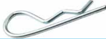
R Pim ШТИФТ R R PIN