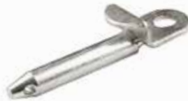
Lamalı Orta Kol Pimi ШПЛИНТ СРЕДНЕГО РЫЧАГА LAMEL LAMEL MIDDLE ARM PIN

23002 19mm 12cm 23003 19mm 15cm 23005 19mm 17cm 23006 22mm 12cm 23007 22mm 15cm 23009 25mm 12cm 23010 25mm 15cm 23013 28mm 12cm 23014 28mm 15cm 10029 19mm 9cm 10030 25mm 9cm