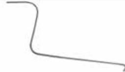
Ot Toplama Çubuğu грабельный зуб RAKE TINE