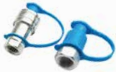
Rox Adaptör НАБОР АДАПТЕРОВ ROX ROX ADAPTER SET