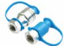
Tümosan Damper Adaptörü НАБОР АДАПТЕРОВ TUMOSAN ДЛЯ АМОРТИЗАТОРА TUMOSAN DAMPER ADAPTER SET