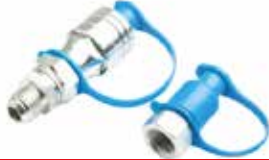
Massey Damper Adaptörü АДАПТЕР MASSEY ДЛЯ АМОРТИЗАТОРА MASSEY DAMPER ADAPTER