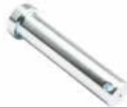
Askı Kol Pimi ШТИФТ ПОДВЕСКИ SUSPENSION ARM PIN