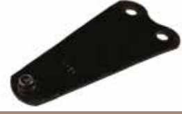
Çayır Viçağı Laması ЛАМИНАТ ДЛЯ ЛЕЗВИЯ ТРАВЫ GRASS BLADE LAMINATION