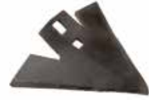
Kaz Ayağı ДОЛОТО 6 ММ 24 СМ ГОРИЗОНТАЛЬНОЕ - DEMİRAY 6 MM CHISEL PLOW 24 CM HORIZONTAL - DEMİRAY

28001 6mm Isıl İşlemlili 28018 8mm Isıl İşlemlili 28098 8mm 28209 7mm