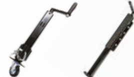
Kriko ДОМКРАТ ДЛЯ ЛОДКИ С КОЛЕСОМ BOAT JACK WHEELED