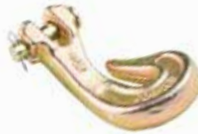
Zincir Kançası ИЗОГНУТЫЙ КРЮК CROOKED HOOK

16073 12mm 16075 16mm 16074 14mm 16086 10mm