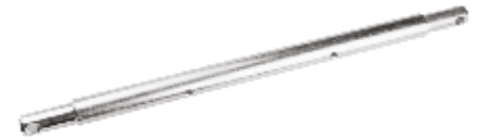
Gövde Pernosu 51 cm ШПЛИНТ КОРПУСА 51 см ТОНКИЙ BODY PIN 51 cm