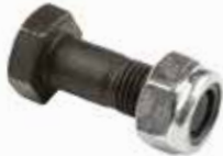
Rotavatör Civata ve Somunu БОЛТ + ГАЙКА РОТОВАТОРА (M1440 10.9 специальный) ROTAVATOR BOLT + NUT (M1440 10.9 special)