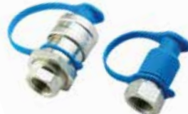
Steyr Damper Adaptörü АДАПТЕР STEYR ДЛЯ АМОРТИЗАТОРА STEYR DAMPER ADAPTER