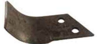
Ara Çapa Bıçağı ЛЕЗВИЕ ИНТЕРДИСКА YURDUSAR - KILIÇARSLAN YURDUSAR INTERROW HOE BLADE - KILIÇARSLAN

28062 8mm C Tip 28064 7mm L Tip 28063 8mm L Tip 28049 7mm C Tip