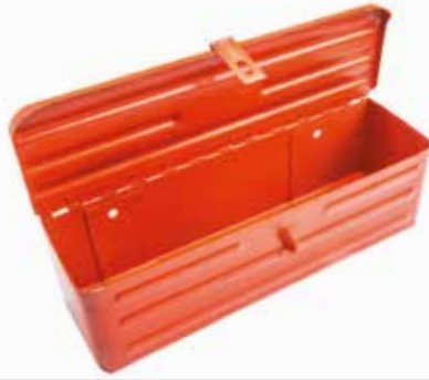
Takım Çantası ЧЕРНЫЙ ЯЩИК ДЛЯ ИНСТРУМЕНТОВ TOOLBOX

20029 Siyah 20042 Kırmızı 20031 Mavi 20041 Turuncu 20043 Küçük