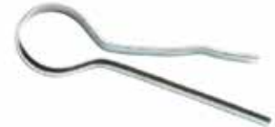
Yarım Yuvarlak Firkete ПОЛУКРУГЛАЯ ВИЛКА HALF ROUND FORK