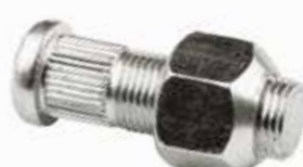
Römork Bijonu ШПИЛЬКА ПРИЦЕПА TRAILER STUD

25001 3 Ton 5/8 25002 5 Ton 3/4 25003 5 Ton 3/4 Uzun