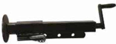
Römork (Tanker) Krikosu ДОМКРАТ ПРИЦЕПА TRAILER JACK