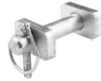
Sınırlayıcı Bağlantı Pimi ШПЛИНТ УСТАНОВКИ ТТ С ДИАМЕТРОМ 25 ММ TT SERIES LIMITING CONNECTION PIN 25MM