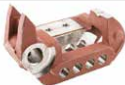
Hidrolik Yay Sehпасı СТОЙКА ГИДРАВЛИЧЕСКОЙ ПРУЖИНЫ (ЧЕТЫРЕ ОТВЕРСТИЯ) HYDRAULIC SPRING STAND (FOUR HOLES)