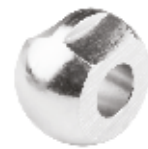
Dana Gözü ГЛАЗ БУКВАЛЬНО С ШИРОКИМ ОТВЕРСТИЕМ BULL'S EYE WIDE HOLE