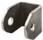
Römork Bağlantı Çekisi КОРОТКАЯ ТЯГА ПРИЦЕПА SHORT TRAILER CONNECTION TOW