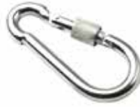
Vidalı Karabina ВИНТОВОЙ КАРАБИН SCREW CARABINER