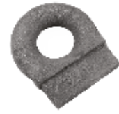
Römork Çeki Halkası ТЯГОВОЕ КОЛЬЦО ПРИЦЕПА TRAILER TOW RING