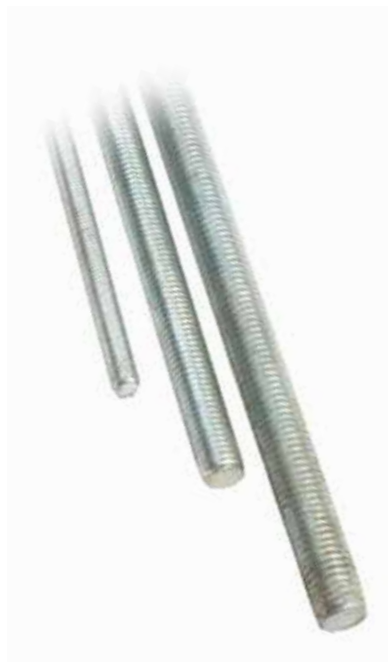
1 metre Gijon СТРОПА 2 ТОННЫ THREADED ROD

22005 16x100mm 22007 16x150mm 22006 16x120mm