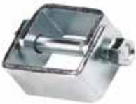
Transit Menteşesi ПЕТЛЯ ДЛЯ ТРАНЗИТА TRANSIT HINGE

16078 1/4 (6mm) 16080 5/16 (8mm) 16079 3/8 (10mm) 16087 1/2 (12mm)