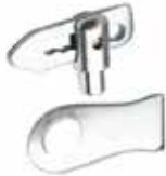
Pikap Kilidi НАБОР ЗАМКОВ ДЛЯ ПИКАПА PICKUP LOCK SET

16053 Kısa 16054 Uzun 16094 İlave Baba Erkeği 160123 Dipsiz