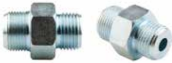
Adaptör Rakor ПРОМЕЖУТОЧНЫЙ СОЕДИНИТЕЛЬ INTERMEDIATE CONNECTOR