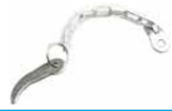
Kasa Kaması МАЛЫЙ КЛИНОВОЙ БЛОК SMALL WEDGE BLOCK

16046 Tekli 16047 Çiftli 16050 Zincirsiz