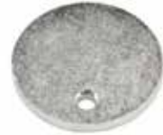
Hidrolik Çanak Tapası ПРОБКА ГИДРАВЛИЧЕСКОГО СТАКАНА HYDRAULIC CUP PLUG