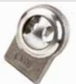
Yan Kol Başı ГОЛОВА БОКОВОЙ РУЧКИ MF 165-640 E.M. С ДВОЙНЫМ ОТВЕРСТИЕМ 28-22 мм MF 165-640 E.M SIDE ARM HEAD DOUBLE HOLE 28-22 MM