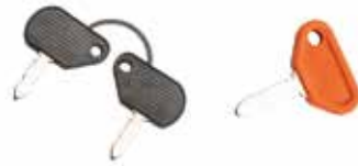
Kontakt Anahtarı ОДНОКОНТАКТНЫЙ ВЫКЛЮЧАТЕЛЬ SINGLE CONTACT SWITCH