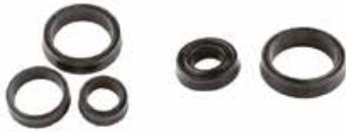
Piston Keçe Takımı УПЛОТНЕНИЕ ПРИЦЕПА TRAILER SEAL