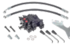
Damper Valfi КЛАПАН С ДВУМЯ ВЫХОДАМИ DUMPER VALVE

25055 MF iki çıkış 3x8 26012 FIAT İKİ ÇIKIŞ 3x8 25058 MF dört çıkış 3x8 26014 FIAT dört çıkış 3x8 26011 MF altı çıkış 3x8 26016 FIAT altı çıkış 3x8