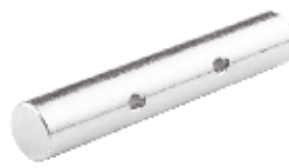
Alt Çeki Sallama Pimi ПРЯМОЙ КАЧАЮЩИЙСЯ ШТИФТ НИЖНЕЙ ТЯГИ LOWER LINK SWINGING PIN STRAIGHT