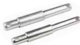
Aysan Tiller Pimi ПРЯМОЙ ШПЛИНТ ПЛУГА AYSAN AYSAN STRAIGHT TILLER PIN