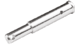
Gövde Pernosu Eski Model ШПЛИНТ КОРПУСА Е.М. BODY PIN E.M.