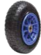
Ei Arabası Tekerı