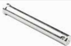
Q16mm Pim ШПЛИНТ PIN

22001 12x60mm 22003 12x100mm 22002 12x80mm 22004 12x120mm