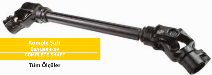
Komple Şaft Вал целиком COMPLETE SHAFT