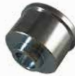
Hidrolik Çanak Burcu ГИДРАВЛИЧЕСКИЙ СТАКАНЧИКОВЫЙ ВТУЛКА HYDRAULIC CUP BUSHING