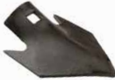
Kırlangıç Bıçağı СРЕДНИЙ АYSAN SWALLOW AYSAN SWALLOW MIDDLE