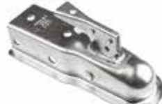
Römork Kilidi ЗАМОК/СЦЕПКА ПРИЦЕПА TRAILER LOCK/COUPLING