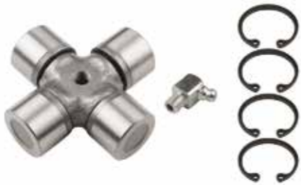
Istavroz КРЕСТОВОЕ СУДНО CROSS JOINT