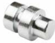
Viçak Tutucu Pim ШПЛИНТ ДЕРЖАТЕЛЯ ЛЕЗВИЯ BLADE HOLDER PIN