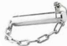
Steyr Orta Kol Pimi ШПЛИНТ СРЕДНЕГО РЫЧАГА STEYR STEYR MIDDLE ARM PIN