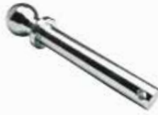
Намаş Topuzu Pimli ЗАКОЛЧЕННАЯ РУКОЯТКА/КНОПКА PINNED HAMMER/TAXI KNOB

16071 28mm 16205 25mm 16126 22mm 16206 30mm